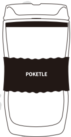
SOU・SOU | POKETLE vidro 330 中空二重ガラスタンブラー-330ml

この取扱説明書をよくお読みの上、正しくご使用ください。 取扱説明書はいつでも再読できるように大切に保管してください。