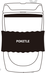
SOU・SOU | POKETLE vidro 220 中空二重 ガラスタンブラー-220ml

この取扱説明書をよくお読みの上、正しくご使用ください。 取扱説明書はいつでも再読できるように大切に保管してください。